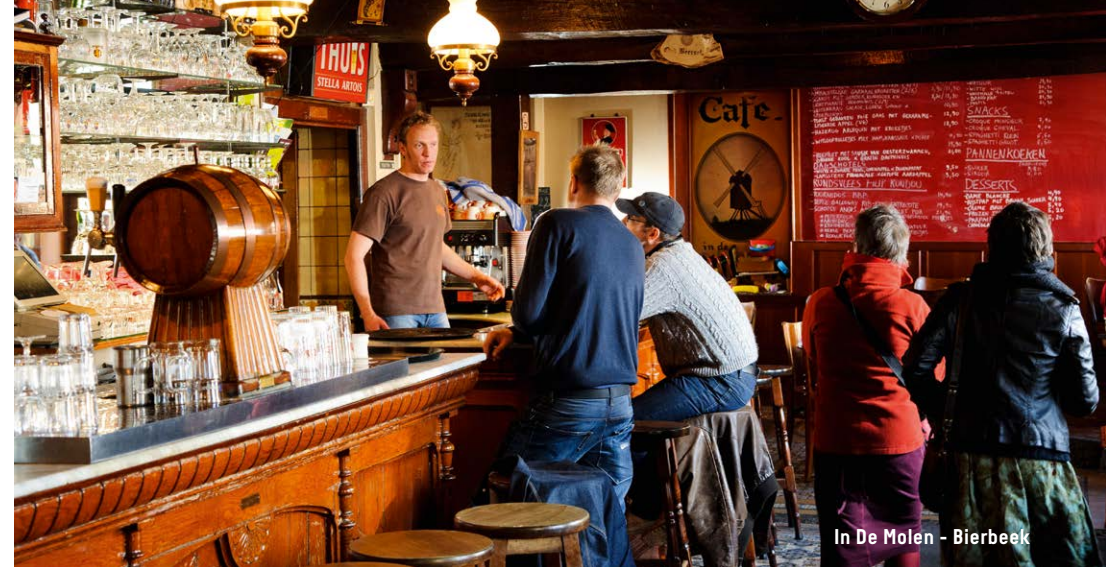
In De Molen - Bierbeek